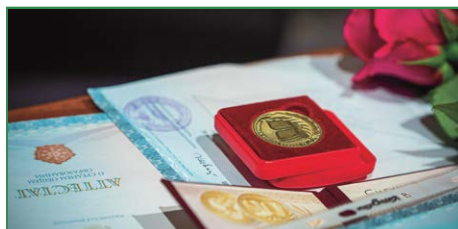
В наукограде прошли выпускные балы