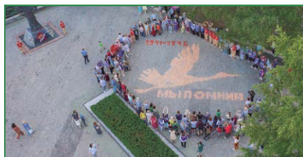
День памяти и скорби в Кольцово